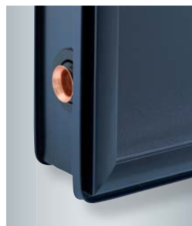
Kollektorrahmen mit speziellem Indachprofil zur Aufnahme des Eindeckrahmens

ThermProtect bewirkt beim Vitosol 200-FM und Vitosol 100-FM gegenüber herkömmlichen Flachkollektoren auch einen höheren Ertrag, da ihre Leistung nicht stagnieren und sie jederzeit wieder Wärme liefern können.